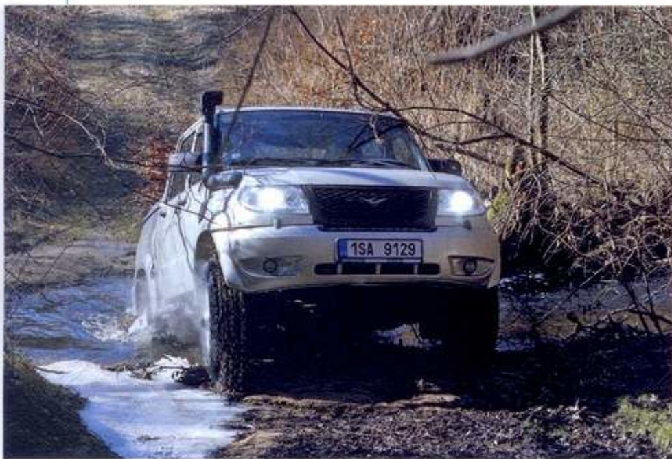
UAZ Pick Up vás nepochybně překvapí svou opravdu mimofádnou průchodností.

Čekala ho cesta na jih, kde se jako manekýn fotil v malebných vesničkách a obcích, u zamrzlých rybníků či se zbytky sněhu po závějích. Venku mrzlo, ale uvnitř bylo příjemně teplíčko. Zlatý hřeb nás ale čekal na sice zmrzlé, ale stále ještě krkolomné