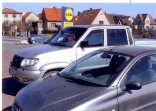
Zaparkujete-li vedle menšího auta, bude vám tak k zrcátkům.

UAZ Pick Up si můžete koupit jako výkonného dělníka od 449 tisíc bez DPH, náš testovací vůz s nejvyšší výbavou Limited stojí od 715 tisíc s daní výše – má elektrické stahování oken, pevné laminátové víko zavazadlového prostoru