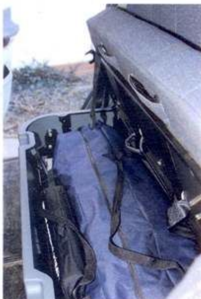
Interiér je praktický a vkusný, pod zadní lavicí je spousta úložného místa.

trati, kde se jezdívá offroadový maraton (poznáte kde?). Na předních kolech je nejprve třeba zvenku přehodit na nábojích režim zadokolky na 4x4, pak trochu obtížně zařadit čtyřkolku a redukci a hurá vstříc prvnímú stoupání. Jak to říkal ten izraelský kapitán? Neubírat, nezastavovat. Na horizontu mizí svět, oblohu střídá pohled do propasti a tak znovu a znovu. Je až neuvěřitelné, co tohle auto projede, jak je vysoké, jak nikde ani neškrtné podvozkem, ani tam, kde se mi je chtělo očima nadnášet v hlubokých kolejích. Po půl hodince je jasné, že tohle je vůz do nepohody. Kde projde srna, projede i ... vzpomínáte na tu dávnou reklamu?