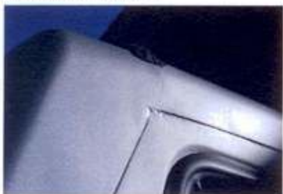
Ne všechny detaily jsou dotažené, ale na praktičnosti a funkčnosti to neubírá.

trati, kde se jezdívá offroadový maraton (poznáte kde?). Na předních kolech je nejprve třeba zvenku přehodit na nábojích režim zadokolky na 4x4, pak trochu obtížně zařadit čtyřkolku a redukci a hurá vstříc prvnímú stoupání. Jak to říkal ten izraelský kapitán? Neubírat, nezastavovat. Na horizontu mizí svět, oblohu střídá pohled do propasti a tak znovu a znovu. Je až neuvěřitelné, co tohle auto projede, jak je vysoké, jak nikde ani neškrtné podvozkem, ani tam, kde se mi je chtělo očima nadnášet v hlubokých kolejích. Po půl hodince je jasné, že tohle je vůz do nepohody. Kde projde srna, projede i ... vzpomínáte na tu dávnou reklamu?