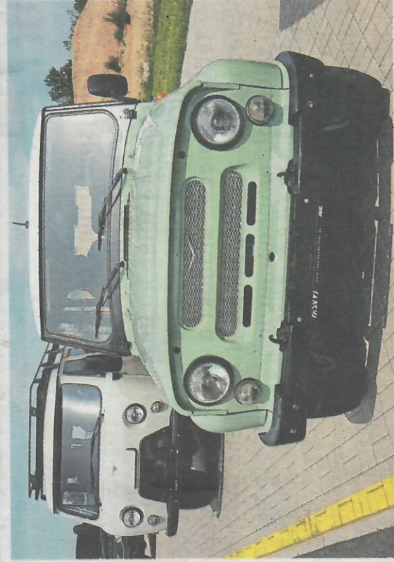
Spartánský interiér Model UAZ 3151 Hunter (vlevo) a jeho strohý interiér s plně manuálním ovládním (vpravo). Na prostředním snímku palubní deska vozu Lada Niva 3-Doors Extreme Cross AMC.