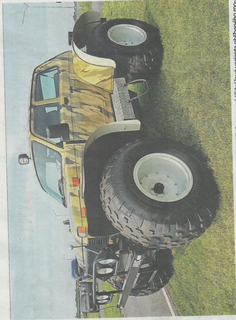
Monstrum z Togliatti Lada Niva 3-Doors Extreme Cross je speciálně upravená třídveřová varianta oblíbeného mo- delu z Togliatti. Její světla výška je 470 milimetrů a váží dvě tuny.

Osvědčená Lada Niva, její „monster“ verze, ale i vlnkový offroad UAZ či terénní mikro- bus přezdívaný Buchanka. Na letišti v Hradci Králové dovoz- ce představil současně ruské terénní vozy. Lu-